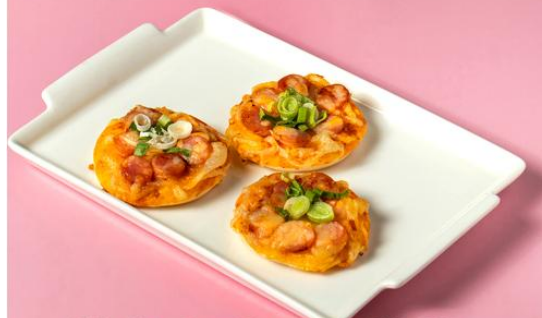
迷你台式香腸披薩