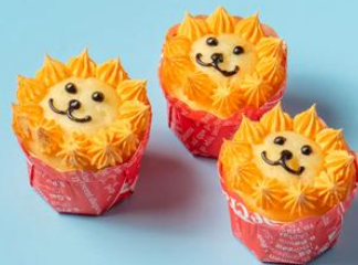
小獅王檸檬杯子蛋糕