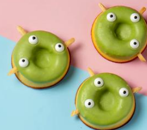
三眼怪抹茶甜甜圈