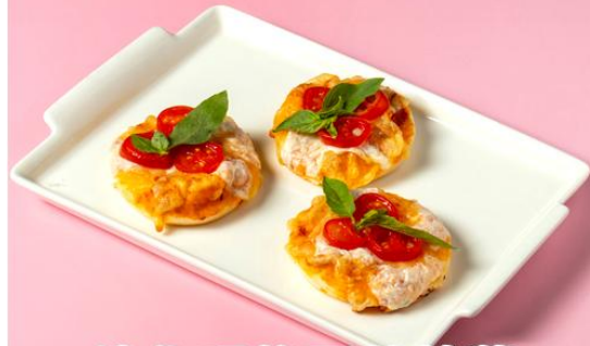
迷你瑪格麗特披薩